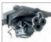
Tecnología X-Torq® y SmartCarb™