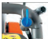
Menor barro y consumo de agua