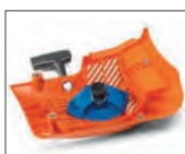
Encendido EasyStart y DuraStarter™