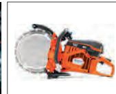
Robusta y confiable