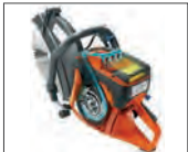
Active Air Filtration™