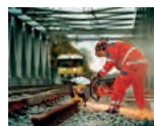
Montaje rápido y estable en la vía