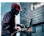
Método de corte eficiente y kit húmedo