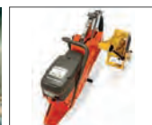
Corte desde ambos lados de la vía