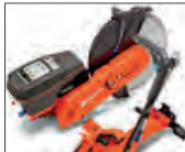
Muy baja vibración con anti-vibration system