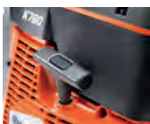
Encendido EasyStart y DuraStarter™