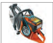
Active Air Filtration™