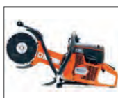
Liviana, potente y con desgaste reducido