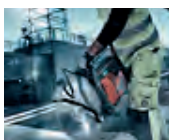
Rápida detención de disco y cambio ágil