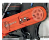
Corte cercano a muros o piso