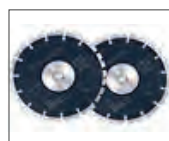
Discos performantes y rompedor incluido