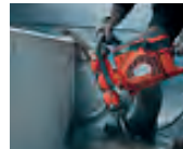
Montaje rápido y estable en la vía