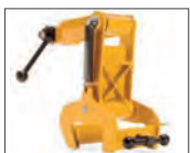
Accesorio RA10 incluido (506226611)

Cortar una vía de tren requiere potencia, precisión y rapidez. La K 1260 Rail es la cortadora más potente del mercado, desarrollada especialmente para las vías férreas . Corta rápido y directo, el soporte se monta rápidamente al rail y el soporte para montaje doble le permite cortar en cualquier dirección. Alta potencia, menos combustible, cortes perfectos en ángulos rectos, corta desde ambos lados. Accesorio RA10 incluido.