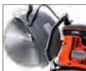
Liviana, potente y con desgaste reducido