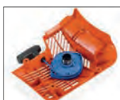
Arranque y filtro casi no requiere manteni.