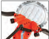
Corte profundo por unidad periférica

Este sistema de corte es un método muy veloz para hacer aberturas pequeñas y medianas. La relación de potencia/peso y filtrado de aire es excelente junto a su sistema de amortiguación de vibraciones de alta eficacia. Cuando necesite realizar cortes profundos rápidamente , la K970 Ring es la respuesta. Tiene una profundidad excepcional de corte de 270 mm, el doble de la cantidad de una cortadora de corriente tradicional.