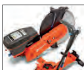
Muy baja vibración con anti-vibration system