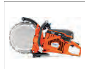
Liviana, potente y con desgaste reducido