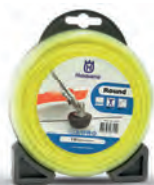
Hilos Redondos Blister