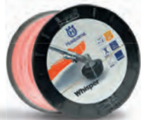
Hilos Whisper Bobina