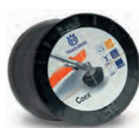
Hilos Coex Bobina