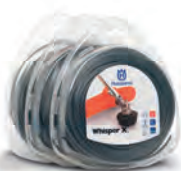
Hilos Whisper Blister