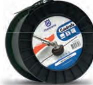
Hilos Cuadrados Bobina