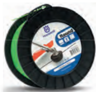
Hilos Redondos Bobina